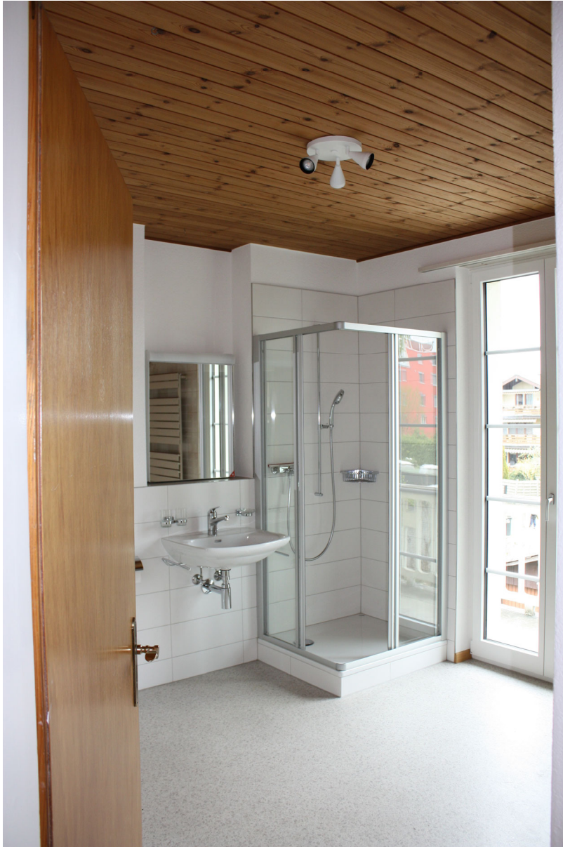
Grosszügiges Bad mit WC & Dusche im 1. Obergeschoss