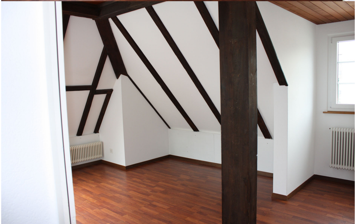
Originelle Schlafräume im 2. Obergeschoss