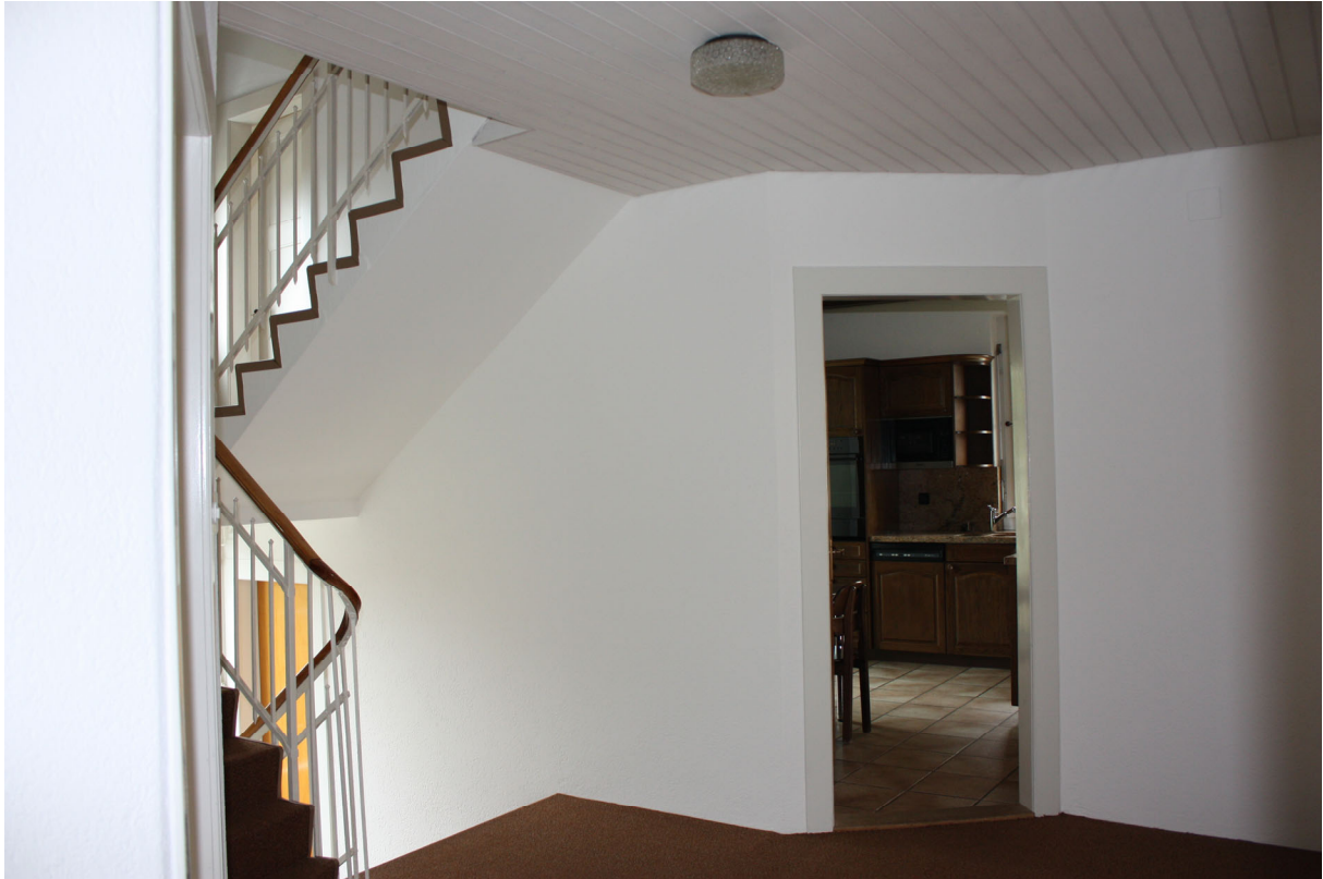
Grosszügiger Korridor mit Treppenaufgang