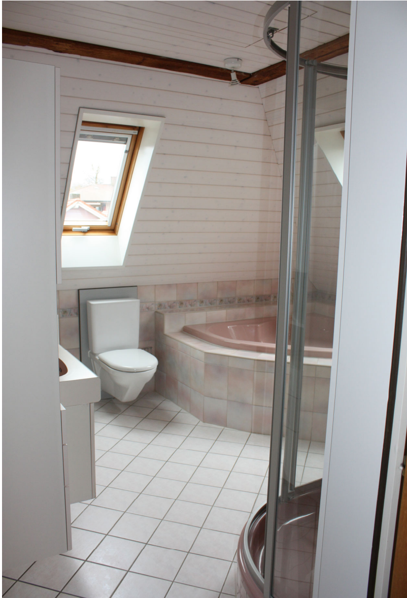
Originelles Badezimmer mit WC, Dusche, Badewanne sowie Doppelwaschtisch im 2. Obergeschoss