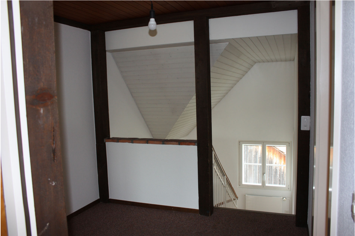
Loftmässiger Korridor mit Treppenaufgang zu 2. Obergeschoss

Private-Groupfitness. small but powerful.