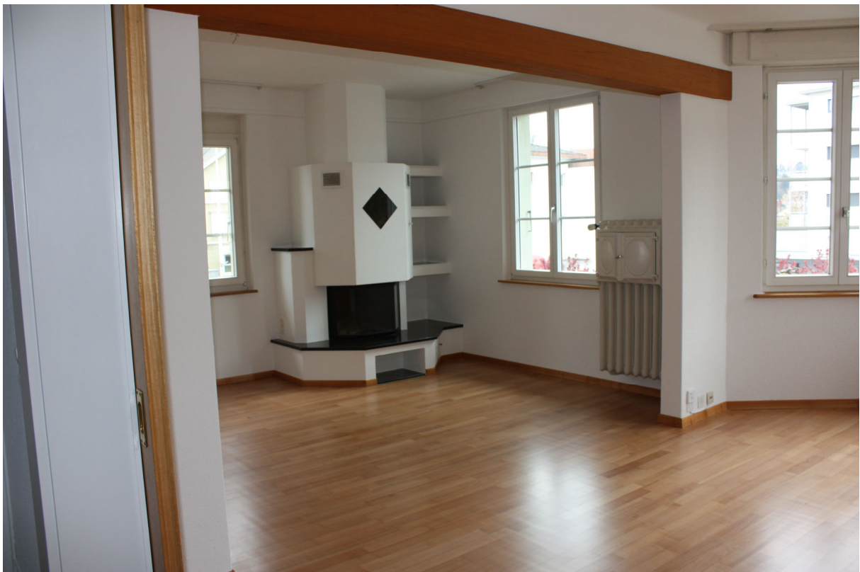
Grosses Wohn- & Esszimmer mit Warmluft-Cheminée und schöner Erker