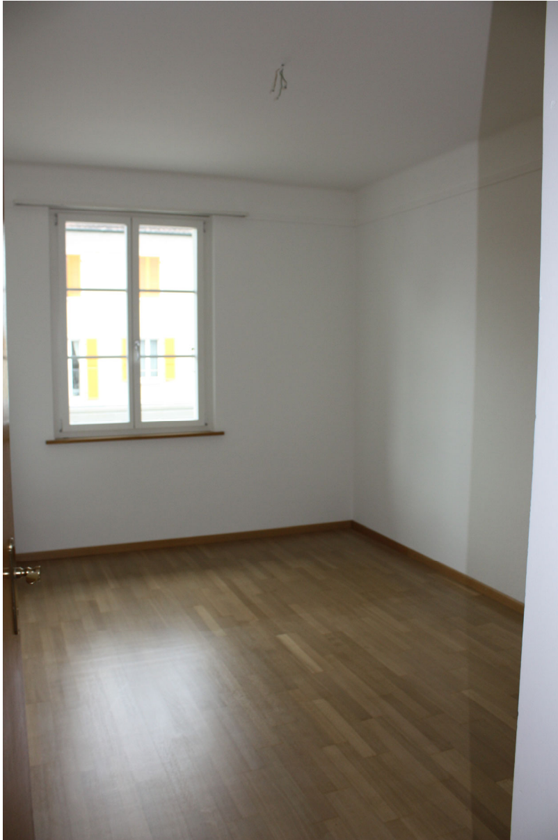
Büro oder Schlafzimmer im 1. OG mit Parkettboden